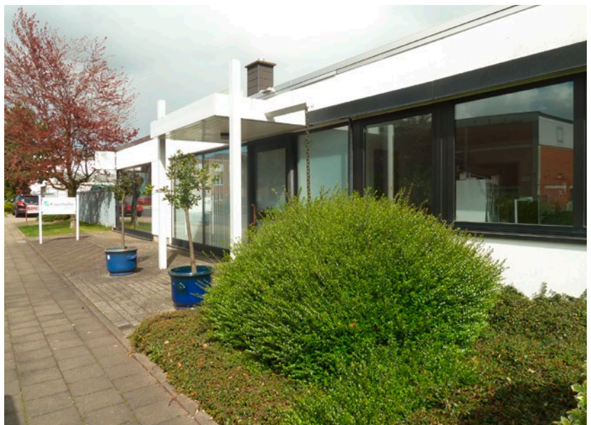
Foto unten: Eingang zum Technikum Siemensring 53. Falls nicht besetzt, bitte im Siemensring 79 (FKuR Kunststoff GmbH) anmelden.

Foto Vorderseite: Großtechnikum Fraunhofer UMSICHT, Außenstelle Willich.